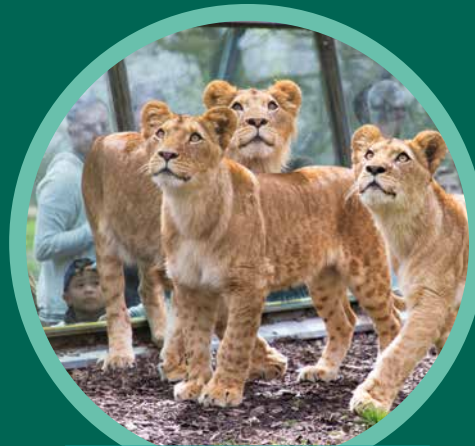
Tunnel de verre